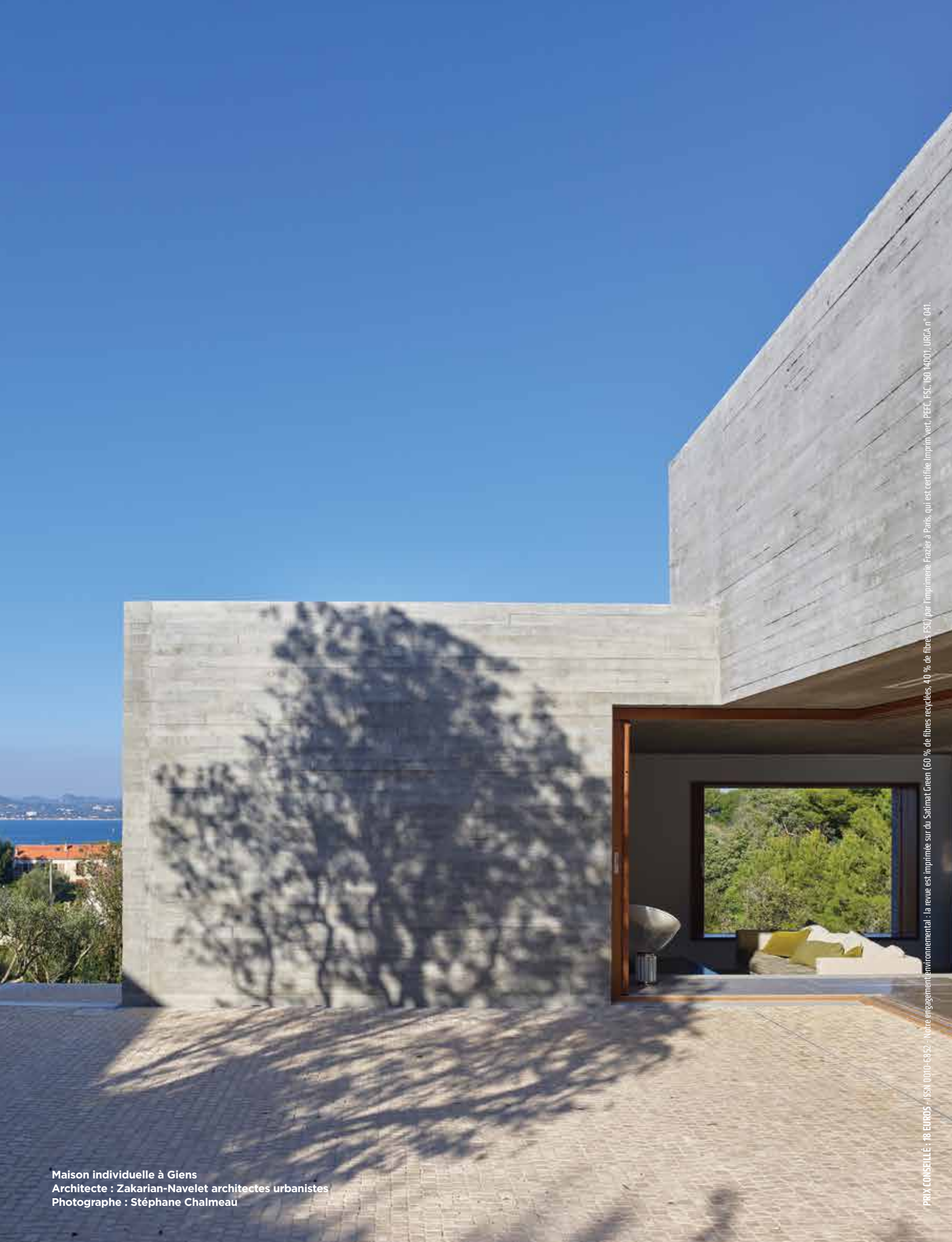
Maison individuelle à Giens Architecte : Zakarian-Navelet architectes urbanistes